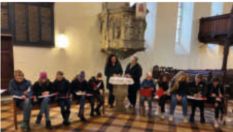
Teenykirche in Gommern