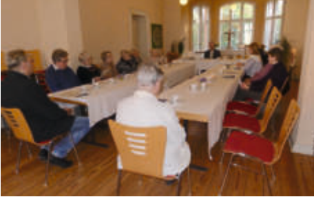
Tischabendmahl am Gründonnerstag