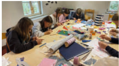
Teenykirche in Gommern