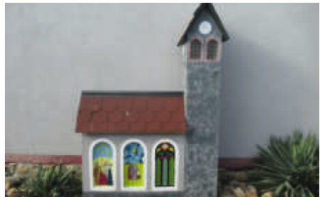
Kirchenmodell in Vehlitz