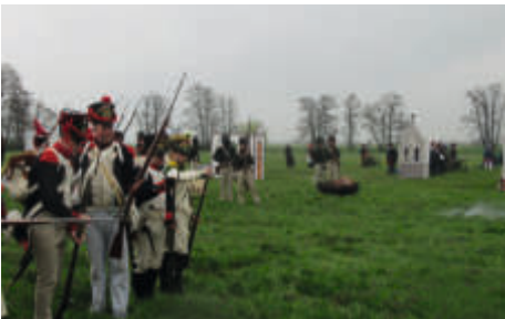
Gefecht von 1813 in Vehlitz