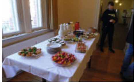
U. B. Abendessen Gründonnerstag